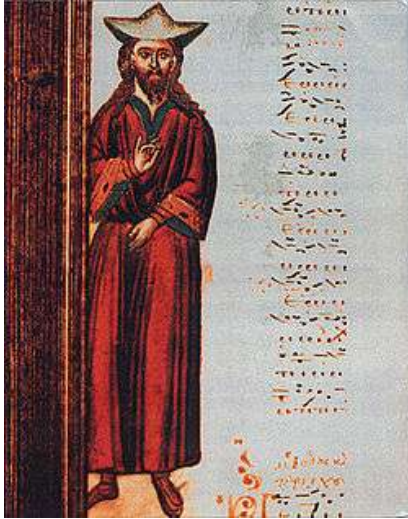
Ο Ιωάννης Κουκουζέλης σε κώδικα του 15 ου αι. Αγιον Όρος. Μεγίστη Λαύρα.

-Ιωάννης Κουκουζέλης, σπουδαίος μελοποιός, επικληθής και <<Μαϊστωρ της μουσικής>>. Αποτελεί σταθμό και θεωρείται η Δευτέρα πηγή της μουσικής μετά τον Ιωάννη Δαμασκηνό. (Ακμάζει περί τον ΙΓ αιώνα).